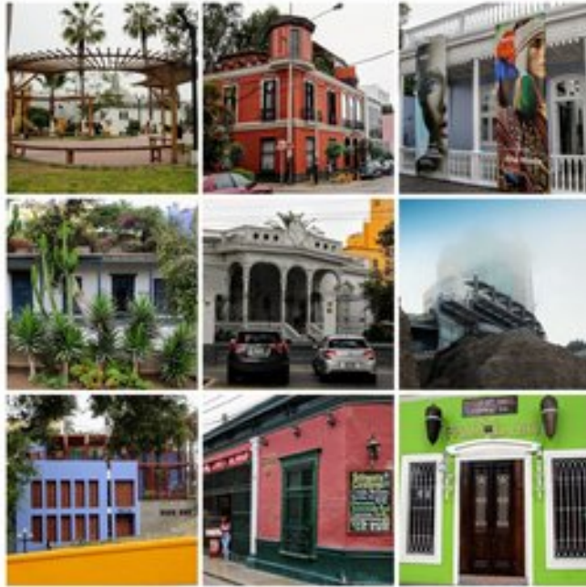
Arhitectura in Barranco

Astăzi, plajele aparținând de Barranco sunt printre cele mai populare în cadrul comunității de surfing din întreaga lume, iar un port sportiv finalizat în 2008 oferă servicii de ultimă generație pentru clubul său de iahturi.