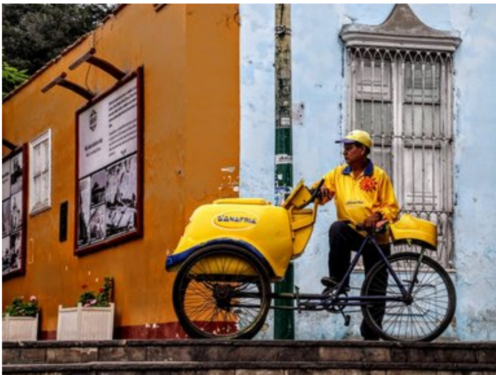
Vânzătorul de Înghețata - un Personaj omniprezent

Temele abordate de Fania Fernandez stau în transcendența lumii fizice, spre spiritual. Este influențată de cultura tatuajului și de căutarea unor forme organice perfecte bazate pe vitralii. Ayahuasca, cunoscută și sub numele de yagé, este un fel de vin originar din bazinul Amazonului care este utilizată pentru a produce o substanță psihoactivă puternică. Licoarea de ayahuasca rezultantă a fost folosită ca medicament spiritual tradițional de către triburile indigene din regiune timp de mii de ani.