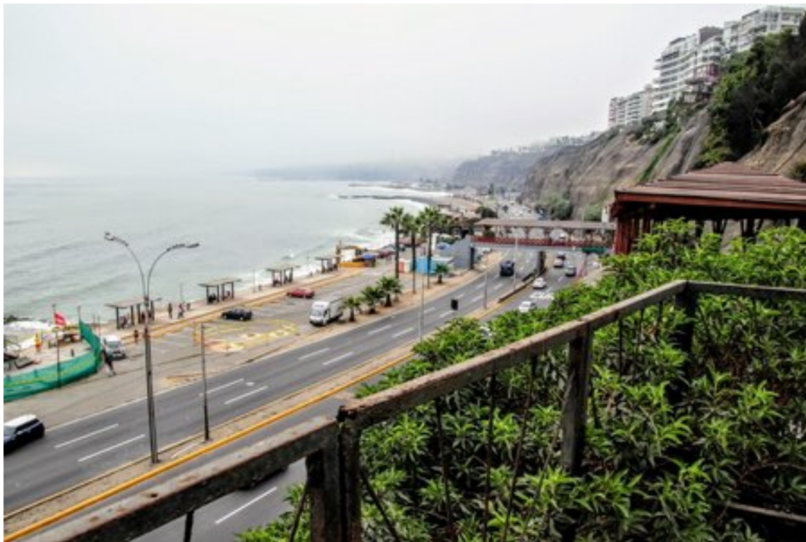
Coasta Oceanului văzut din Bajada de los Banos

Barranco înseamnă ravenă sau râpă, ceea ce nu este întâmplător, pentru că descrie topografia zonei. Barranco este unul dintre cele 43 de districte metropolitane ale Limei și unicul care a preluat denumirea caracteristică topografiei locului. De fapt aproape toată coasta Pacificului adiacentă zonei metropolitane este o ravenă impresionantă, care se ridică până la 80 de m de-asupra nivelului Oceanului, ceea ce oferă o priveliște deosebită asupra plajelor de nisip relativ înguste și a oceanului, brăzdat de valuri ideale pentru practicarea surfing-ului.