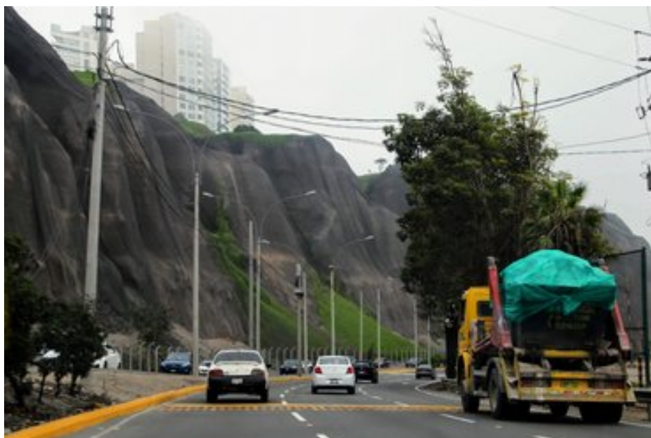
Șoseaua de acces de pe Plaja

Ca să ajunge în Barranco am apelat la un serviciu Uber, care este foarte popular datorită sistemului informatic de care dispune și care permite optimizarea în timp real a traseului, ceea ce este avantajos în Lima, care este una din metropolele cele mai congestionate din lume din punct de vedere al traficului. Am folosit șoseaua de coastă pentru a ajunge la Barranco dinspre plajele din vest. În imagine de mai jos se poate observa denivelarea accentuată a zonei unde s-a dezvoltat Barranco față de coasta propriu-zisă.