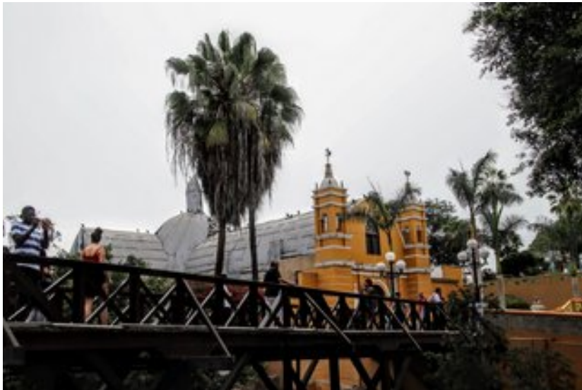
Puente de los Suspiros și Biserica La Eremita

Există o coborâre spre ocean care trece prin Barranco, numită „Bajada de los Baños”. Peste această coborâre se află o pasarela numită „Puente de los Suspiros” (Podul Suspinelor), care traversează râpa în sine și a fost inaugurat în 1876. Datorită tradiției populare care a marcat locul ca punct de întâlnire pentru îndrăgostiți, podul a fost denumit „de los suspiros”.